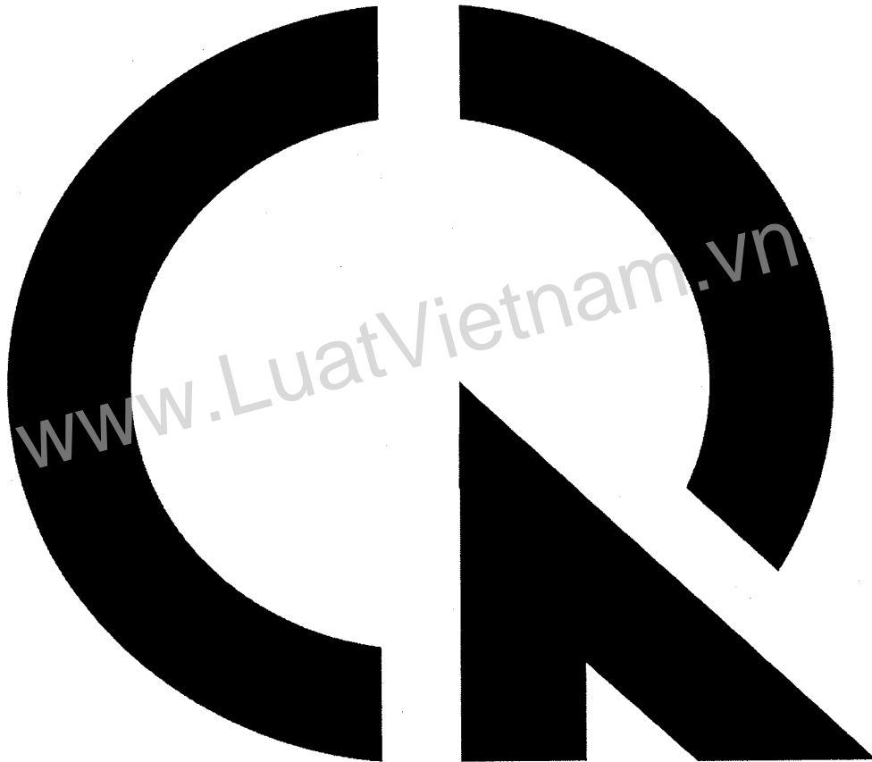
Hình 1. Hình dạng của dấu hợp quy

1. Dấu hợp quy có hình dạng được mô tả tại Hình 1.