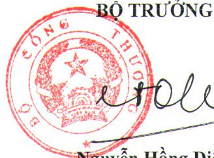
Nguyễn Hồng Diên