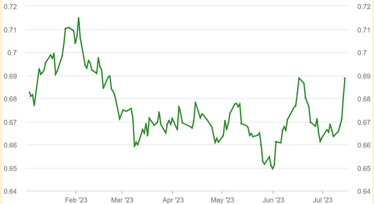
Graph of the AUD/USD exchange rate